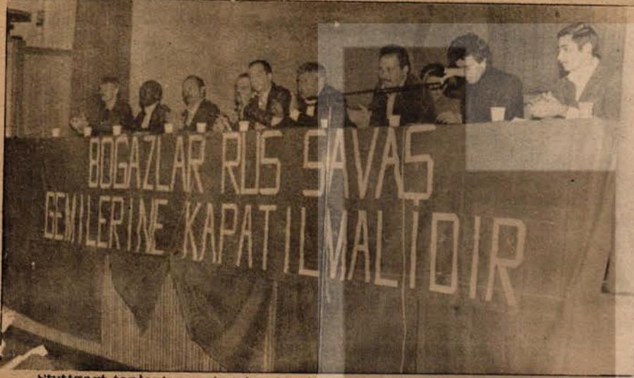
Stuttgart toplantısına katılan Marksist-Leninist ve anti emperyalist parti temsilcileri toplantı kürsüsünde bir arada.

"Halkımızın ve dünya halklarının üzerinde hegemonya kurma çabalarını hızlandıran, Yeni Çarlarla anlaşma yapmaya hazırlanan bağımsızlığımızı düşmanı faşist MC hükümetini şiddetle protesto ediyoruz."